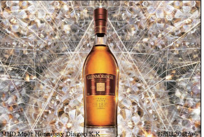
MHD Moët Hennessy Diageo K.K. お酒は20歳から

☎ 06-6718-0304 (代) 06-6718-0304 http://www.uranagase-chair.com 〒544-0025 大阪市生野区生野東2-4-1